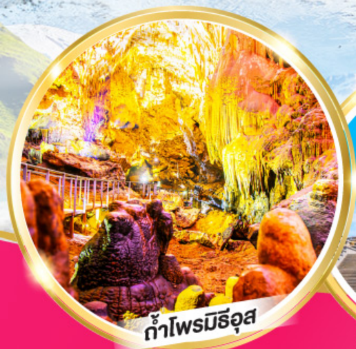
ถ้ำไฟมัลริอุส