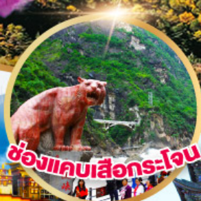
ช่องแคบเสีอกระโหลก