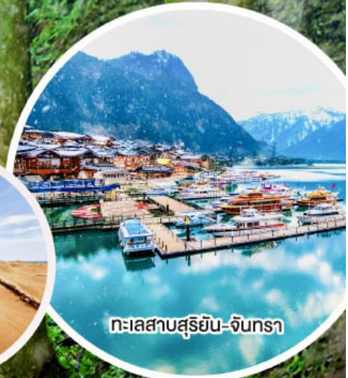
ทะเลสาบสุริยอัน-จินกรา