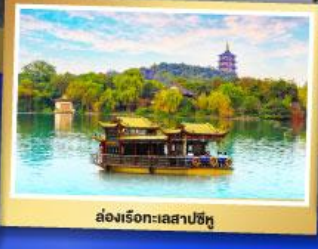
ล่องเรือทะเลสาปซีหู