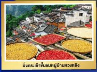
นั่งกระเช้าขึ้นชมหมู่บ้านหวงหลิง