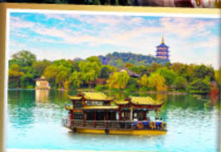
ล่องเรือทะเลสาบซีหู