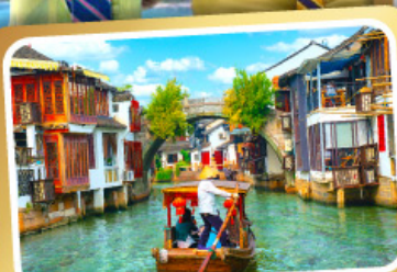
ล่องเรือเมืองโบราณซูเจียเจียว