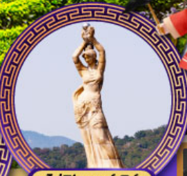
จูไห่พิงเซอร์เกิร์ล