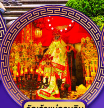
วัดเจ้าแม่กวนอิม ย่องฮ่า