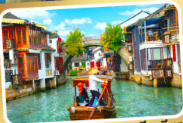
ล่องเรือเมืองโบราณซูเจียเจียว