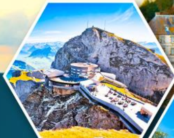
ยอดเขาพิลาตัส