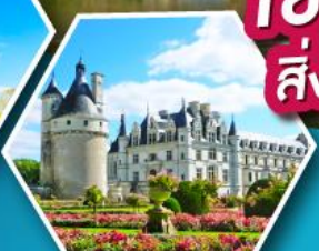
ปราสาทเชอนงโซ

เข้าชมมหาวิหารมองต์แซงต์มิเชล สิ่งมหัศจรรย์ของประเทศฝรั่งเศส