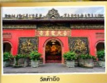
วัดต้าเหิง