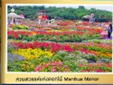
สวนสวรรค์ดอกไม้สีฤดู Mantou Meng