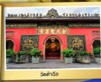
วัดต้าเจี๋ย