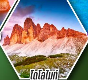
โตโลไมท์

โปรแกรมเที่ยว เก็บครบจบ อิตาลี ตั้งแต่เหนือถึงใต้