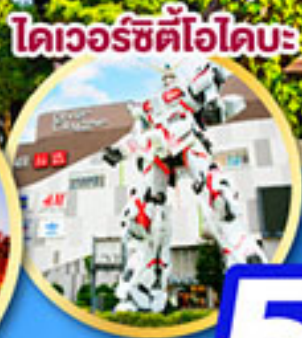
โดเวอร์ซิตีไอบะ