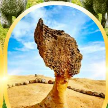
อุทยานแห่งชาติ เย่หลิว