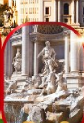
น้ำพุกรวี