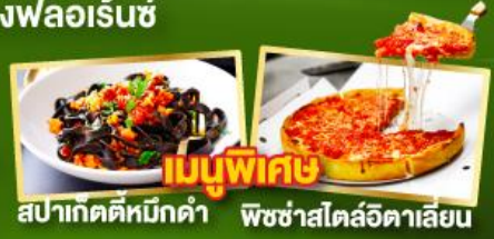
เมนูพิเศษ สปาเก็ตตี้หมึกดำ พิชซ่าสโตร์อิตาลีเลียน