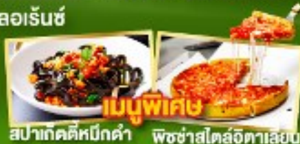
เมนูพิเศษ สปาเก็ตตี้หมักดำ พิชซ่าสโตล์อิตาลี