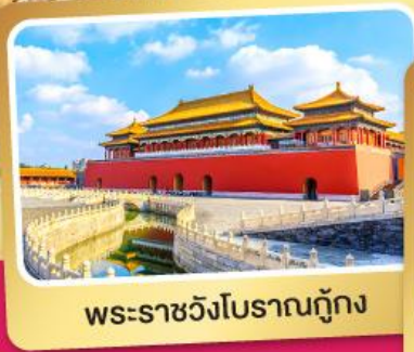
พระราชวังโบราณ