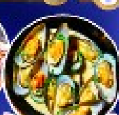
หอยนางรมฝรั่งเศส