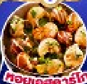
คอตเลตเยอรมัน

เดินทาง 5 17-25 ก.ย.67/11-19,18-26 ต.ค.67 14-22 พ.ย.67/30 พ.ย.-8 ธ.ค.67 25 ธ.ค.67 - 2 ม.ค.68(เทศกาลปีใหม่)