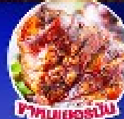
ไก่ทอดเยอรมัน