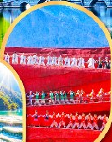
โชว์ Impression Lijiang