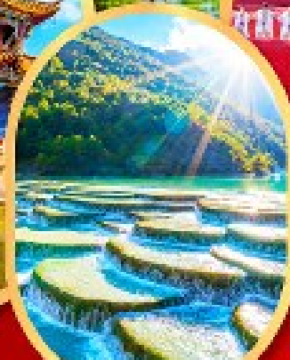
หุบเขาสีน้ำเงิน