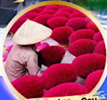
หมู่บ้านรูป Phu Cau