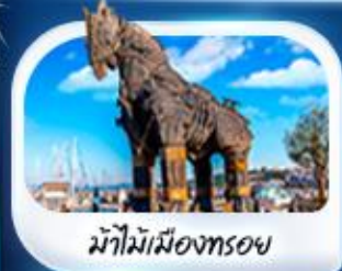
ม้าไม้เมืองทรอย

พิเศษ! ล่องเรือชมความสวยงามช่องแคบ 2 ทวีป "ช่องแคบบอสฟอรัส"