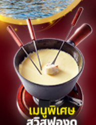
เมนูพิเศษ สวิสฟองดู