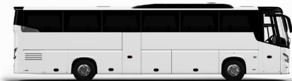
ตัวอย่างรูปภาพรถ 1 ชั้น

หากประเภทห้องที่ท่านริเคอสมามาเต็มออกิ เช่น ริเคอสห้องพักเป็น TWIN BED หรือ DOUBLE BED ทางบริษัทขอสงวนสิทธิ์ในการปรับประเภทห้องพัก เป็น ตามที่โรงแรมมีอยู่ โดยไม่ต้องแจ้งให้ทราบล่วงหน้า