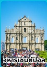
วิหารเซนต์ปอล