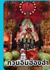
กวนอิมฮ่องกง