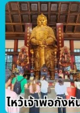
ไหว้เจ้าพ่อก้งหัน