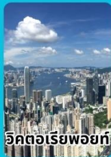
วิวทิวทัศน์ฮ่องกง