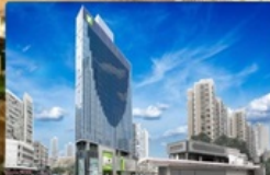
i Club Mongkok