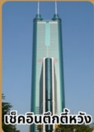
เซ็กอินตักตีห้วง