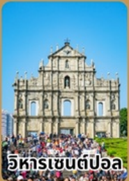
อิหารเซนต์ปอล