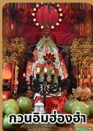
กวนอิมฮ่องฮ่า