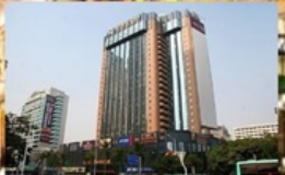
South Union Hotel