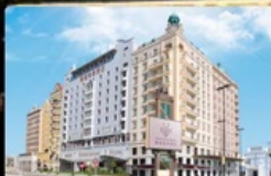
Grand Inn Hotel

กินอิ่ม นอนอุ่น พักหรู อยู่ดี การ์ันตี 4 ดาว