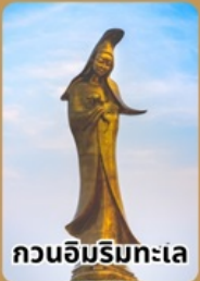
กวนอิมริมทะเล