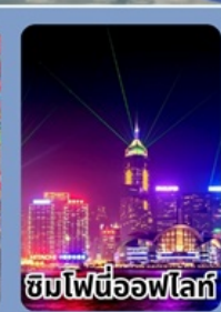
ชมไฟนีออนไฟท์