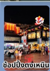
ช้อปปิ้งตงเหมิน