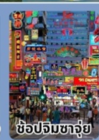
ช้อปปิ้งจว๋ย