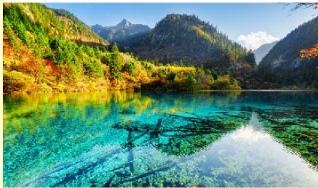
อุทยานแห่งชาติจิวจ้ายโกว