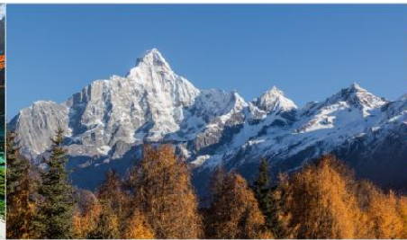
ภูเขาสี่ดรุณี