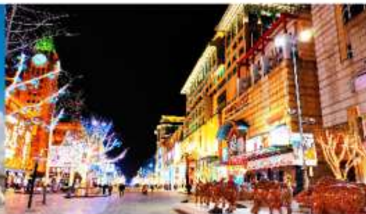
ถนนหวังฟูจิ่ง