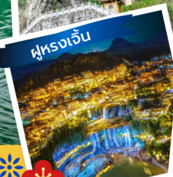
ฟูรงเจิน