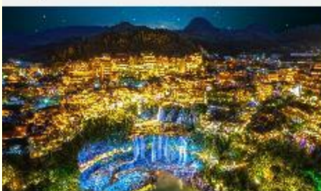
ฝูหรงเจิน