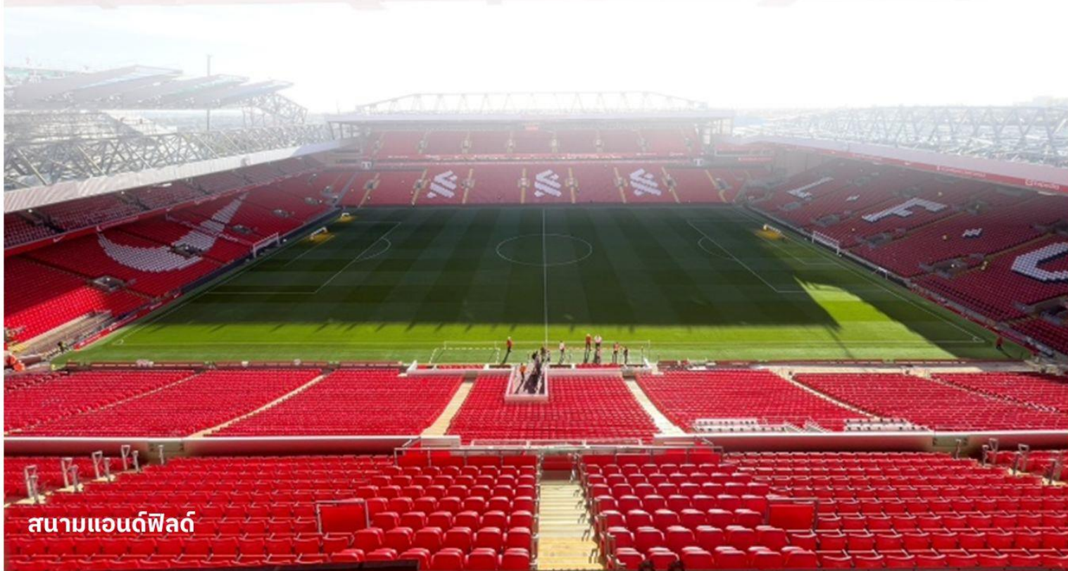
สนามแอนฟิลด์

หนึ่งในสถานที่ท่องเที่ยวที่ใหญ่ที่สุดในเมืองลิเวอร์พูล โดยบริเวณท่าเรือนี้ประกอบไปด้วยอาคารท่าเรือและคลังสินค้า นอกจากนี้แล้วท่าอัลเบิร์ตยังเป็นสถานที่ท่องเที่ยวที่มีคนเข้าชมมากที่สุดในสหราชอาณาจักรอีกด้วย