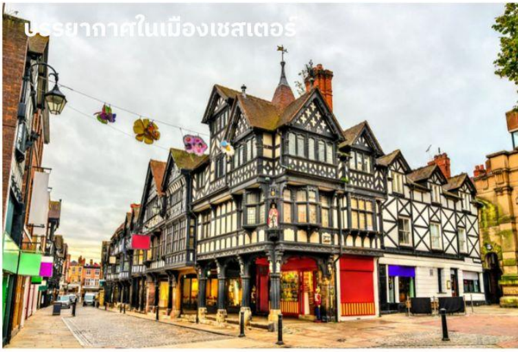
บรรยากาศในเมืองเชสเตอร์

จากนั้นนำท่านเดินทางสู่ เมืองเชสเตอร์ (Chester) ใช้เวลาเดินทางประมาณ 1 ชั่วโมง เชสเตอร์เมืองเก่าที่ค้นพบโดยชาวโรมันเมื่อประมาณ 2,000 ปีมาแล้ว นำท่านผ่านชมตัวเมืองอันสวยงาม ทางตอนเหนือของแคว้นเวลส์ ลักษณะของสถาปัตยกรรมของอาคารบ้านเรือนเป็นแบบทิวดอร์ อันเป็นเอกลักษณ์เฉพาะของที่นี่โครงสร้างตึกและบ้านเรือนที่จะทำจากไม้และทาสีขาวดำซึ่งจะเห็นได้ทั่วไปไปแทบจะทุกถนน ซึ่งเสริมให้บรรยากาศของเมืองนี้มีเสน่ห์ และแฝงความน่ารักเอาไว้ นอกจากนี้ตึกบางแห่งยังเป็นตึกเก่าแก่ตั้งแต่สมัยปี ค.ศ.1488 อีกด้วย