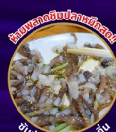
ห้ามพลาดอินปลาหมึกสด!! ซันนั๊กจิ อาหารท้องถิ่น

ถ่ายรูปชิคๆ หมู่บ้านวัฒนธรรมคัมซอน เชคอิน คาเฟ่ริมทะเล วิวหลักล้าน ขึ้นเคเบิลคาร์ ชมทะเลปูซาน นั่งรถไฟปิ๊กปิ๊ก sky capsule ห้ามพลาด!! ตลาดปลาที่ใหญ่ที่สุด ชิมของอร่อยที่ตลาดแฮอุนแด อิสระช้อปปิ้ง Lotte Duty Free