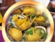
เมนูซีฟู้ดพรีเมียม