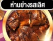
हांอย่างรสเลิศ