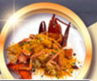
ซิวัดกึ่งมิงท