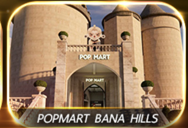
POP MART BANA HILLS

สัมพัสความงามหมู่บ้านฝรั่งเศสที่บานาฮิลล์ ซอปปิง POPMART