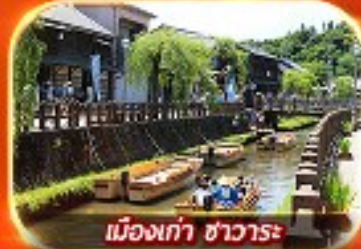
เมืองเก่า ซาวาระ