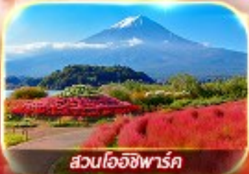
สวนโออิชิพาร์ค