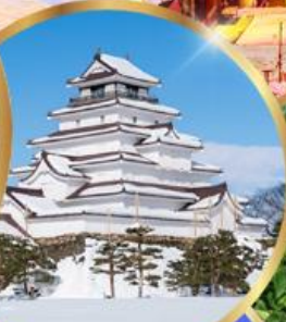
ปราสาทสิรุกะ