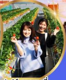
บุฟเฟต์ สตอเบอร์รี่ เก็บสดจากต้น