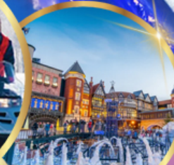
โรงงานช็อคโกแลต ชิโรอิ โคอิมีโตะ