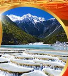
หุบเขาพระจันทร์ สีน้ำเงิน