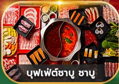
บุฟเฟ่ต์ซาบู ซาบู