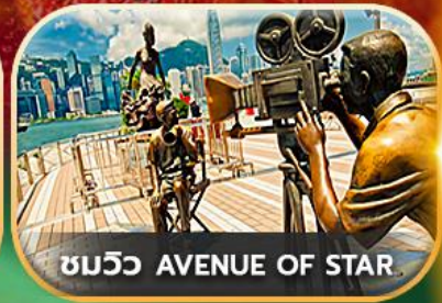
ชมวิว AVENUE OF STAR