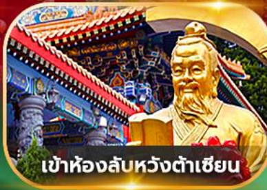
เข้าห้องลับหวังต้าเซียน