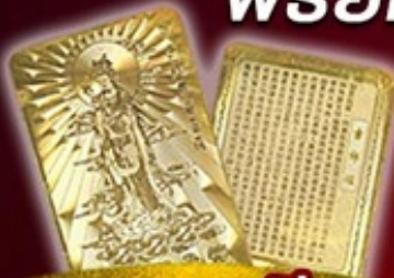
แถมฟรี แผ่นทองเจ้าแม่กวนอิม