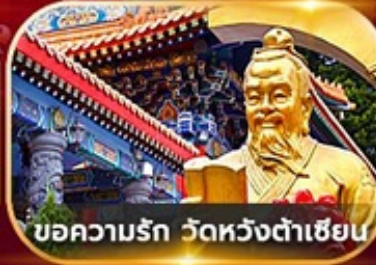
ขอความรัก วัดหวังต้าเซียน