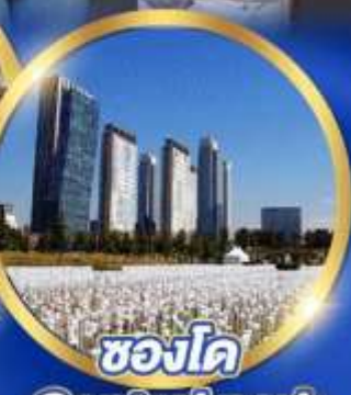
ชองโด Central park