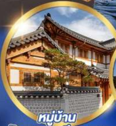
หมู่บ้าน วัฒนธรรมอันยอง