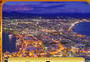
ชมวิวฮาโกดาเตะ