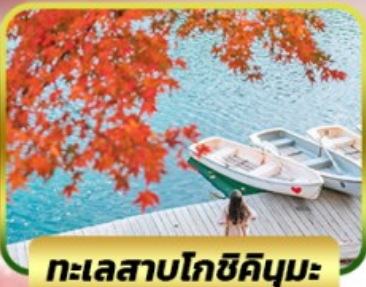
ทะเลสาบโกชิคินุมะ