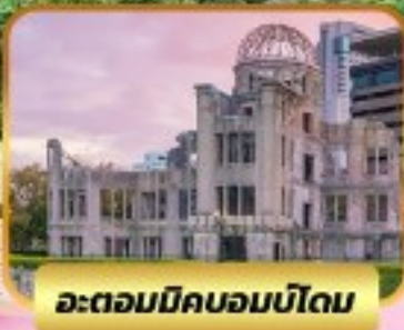
อะตอมบิคมอบบิโดม