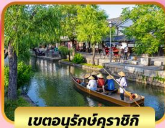
เขตอนุรักษ์คุราซึกิ