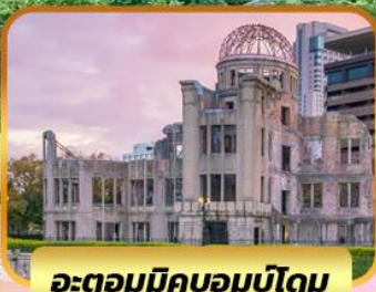
อะตอมมิกบอมบ์โดม