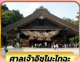
ศาลเจ้าอิซุโมะโทะวะ