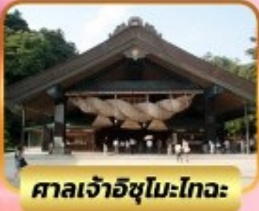
ศาลเจ้าอิซุโมะโทะวะ