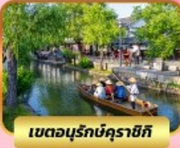
เขตอูร์กบิคุราชิกิ