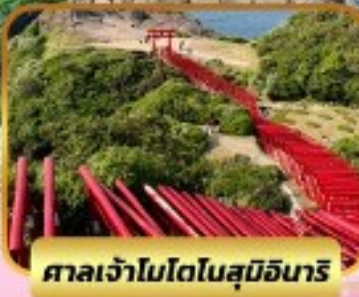
ศาลเจ้าโมโตโนสุมิอินาริ