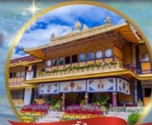
พระราชวัง โนร์บูสิงกา