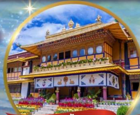
พระราชวัง โนร์บูลิงกา