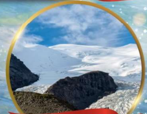
ธารน้ำแข็งคาโนล่า