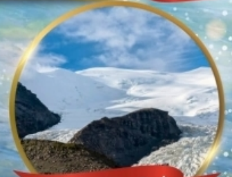
ธารน้ำแข็งคาโนล่า