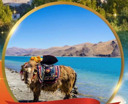
ทะเลสาบยัมดรก