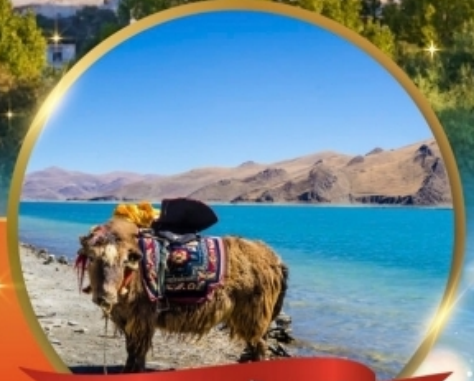
ทะเลสาบยัมดรก

"ริเบต" เมืองมหัศจรรย์หลังคาโลก พระราชวังฤดูหนาวโปตาลา วิวสุดอลังการคาโนล่ากลาเซียร์ อันซีนทะเลสาบศักดิ์สิทธิ์ "ทะเลสาบยัมดรก" พระราชวังโนร์บูสิงกา • วัดต้าเจา วัดที่ศักดิ์สิทธิ์ที่สุดในริเบต • ตลาดบาคอร์