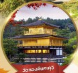
วัดทองคินคะคุจิ