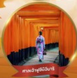
ศาลเจ้าฟูชิมิอิซึนาริ