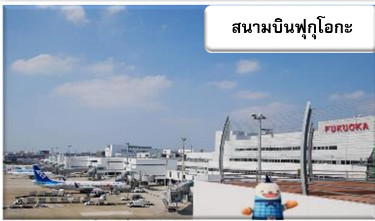
สนามบินฟุกุโอกะ

เวลา 00.55 น. ออกเดินทางสู่ สนามบินฟุกุโอกะ ประเทศญี่ปุ่น โดยสายการบินไทย เที่ยวบินที่ TG 648