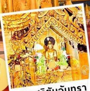
พระสุริยันจันทรา