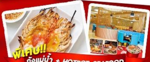
พิเศษ!! ก๊งแม่น้ำ + HOTPOT SEAFOOD