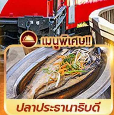
ปลาประดานาธิบดี