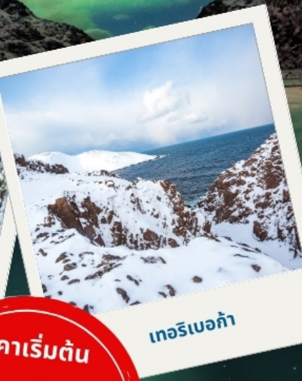
เทอริเบอก้า