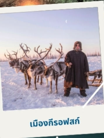
เมืองก็รอฟสค์