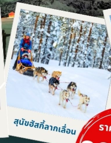
สุนัขฮัสกีลากเลื่อน