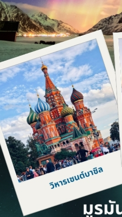
วิหารเซนต์บาซิล