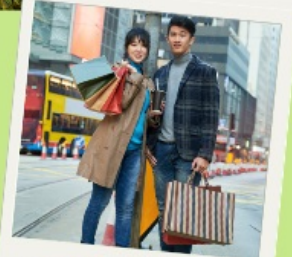
Free time Shopping