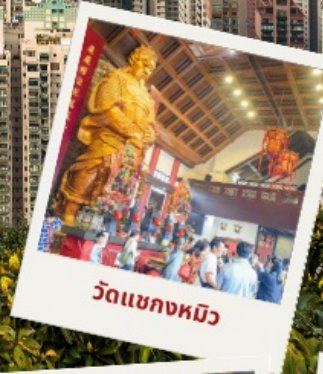
วัดเขangkงหมิว