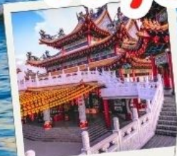
วัดเทียนหัว