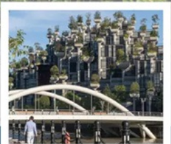
TIAN AN 1,000 TREES